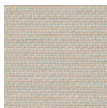
白色/沙滩色 代码: 0460100035717