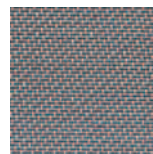
白色/黑色 代码: 0460100035713