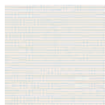
白色/白色 代码: 0460100035711